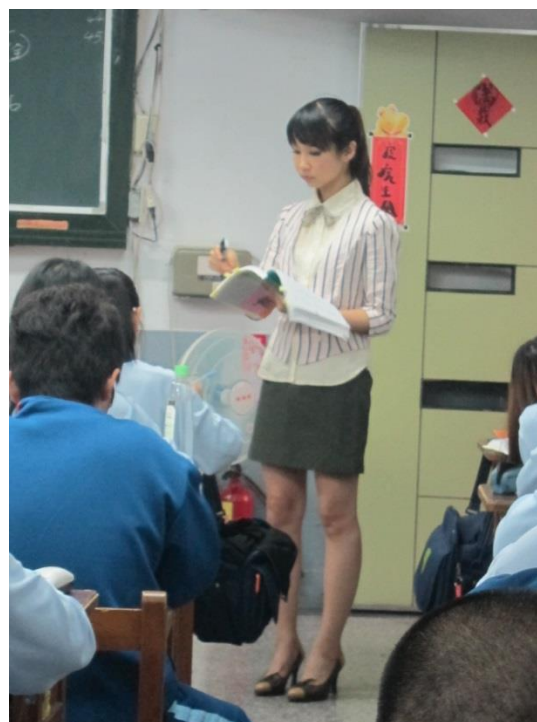
▲ 認真教導學生的英文老師

原來，在就學期間，其實老師的數理科比較好，但，在 16、17 歲時，出乎意料的，她改變了她原本的志向，嘗試向「網拍」行業發展，但在這個行業固然是辛苦的。她很快意識到「網拍」無法賴以維生，便將它當作一個賺取零用錢的興趣。