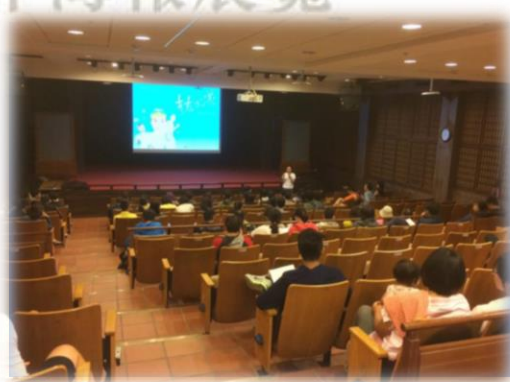
↑ 有趣的影片及演講

1. 到活動頁面 2. 拍照上傳至活動頁面，並且 3. hashtag：#有性趣嗎? #性別電影周